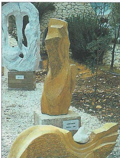
Au premier plan, deux œuvres de l'artiste tunisien: Omar Koreim.

intéressant de la sculpture contemporaine libanaise et internationale.