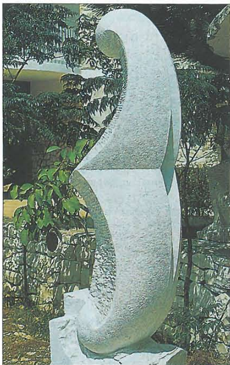
Sculpture de Simon Thomas - Royaume-Uni.

Regroupant des sculptures des frères Basbous (Michel, l'aîné, est décédé en 1981) et les œuvres sculptées au cours des forums successifs, le musée offre un panorama